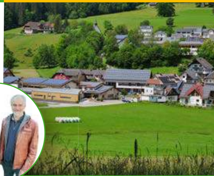
Ansicht Biederbach im Schwarzwald