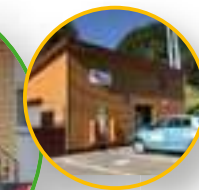
Unsere zwei E-Ladesäulen in Biederbach

BürgerEnergiegenossenschaft Biederbach & Elztal e.G. Sitz: Dorfstraße 18, 79215 Biederbach Büro: Dorfstraße 7, 79215 Biederbach